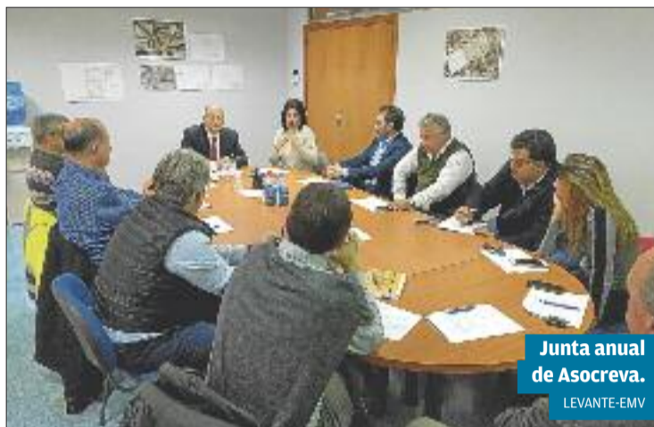
Junta anual de Asocreva.

La asociación tiene como fin defender los intereses de las empresas que están situadas en el polígono industrial de La Reva de Riba-roja de Túria