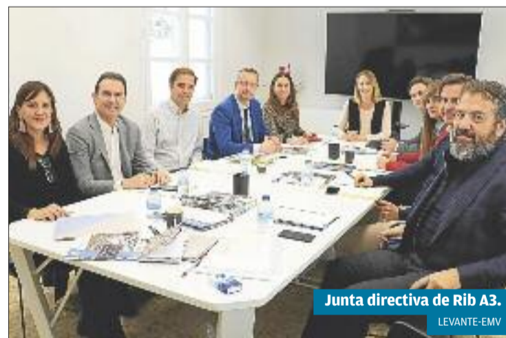
Junta directiva de Rib A3.

El plan estratégico de Rib A3 de 2018 ha multiplicado por tres el número de socios hasta llegar a 120