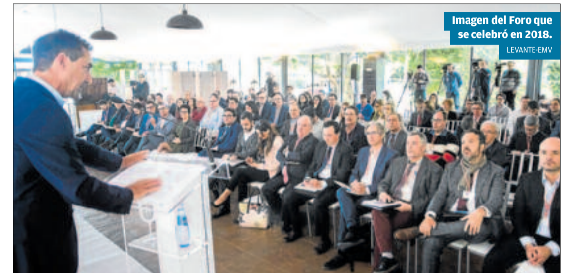
Imagen del Foro que se celebró en 2018.

La jornada tendrá cuatro bloques: la perspectiva de la gestión municipal, la perspectiva de la inversión industrial sostenible, el impacto de la Responsabilidad Social Compartida empresarial en el cumplimiento de los ODS y el futuro del empleo industrial desde la visión del diálogo social