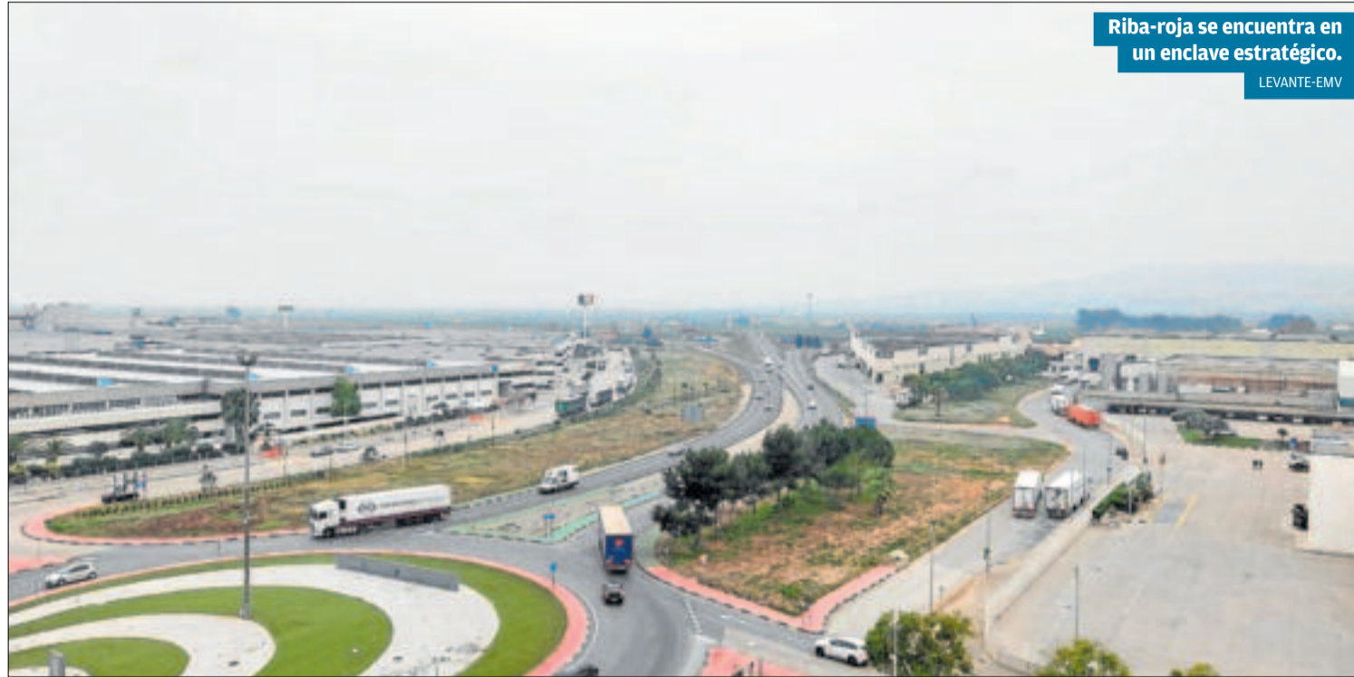
Riba-roja se encuentra en un enclave estratégico.

La segunda edición, que se celebrará el 5 de marzo, reflexionará sobre los procesos de desarrollo e inversión industrial desde una perspectiva eminentemente local, promoviendo la innovación, la sostenibilidad y la colaboración público privada